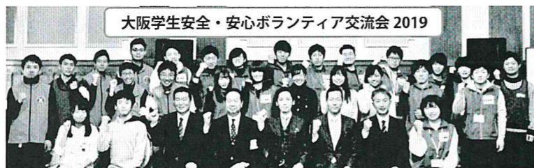
大阪学生安全・安心ボランティア交流会 2019

◆ 大阪府防犯協会連合会では、大学生を中心とした防犯ボランティアの交流会を開催する等、活性化に向けた支援を推進しています。